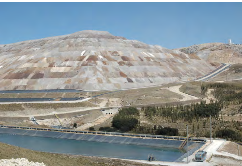
Trotz Nachhaltigkeitskapitel senkte die peruanische Regierung ihre Schutzmaßnahmen für die Umwelt

Seit 2013 wendet die EU die Freihandelsabkommen mit Peru und Kolumbien vorläufig an. Beide Abkommen enthalten ein Nachhaltigkeitskapitel, das vorsieht, dass eine regierungsunabhängige Beratungsgruppe (DAG) eingerichtet wird. Die Regierungen Perus und Kolumbiens blockieren jedoch seit Jahren die effektive Umsetzung einer solchen zivilgesellschaftlichen Beratungsgruppe. Dies ist besonders kritisch, da in den letzten Jahren die Repressionen gegen UmweltschützerInnen und MenschenrechtsverteidigerInnen in beiden Staaten stark zugenommen haben. Neue Gesetze diskriminieren Nichtregierungsorganisationen und die Regierungen verhängten wiederholt den Ausnahmezustand über mehrere Provinzen, in denen die Bevölkerung gegen die massiven Umweltschäden des Bergbaus protestierte. 2 Zudem wurden Bestimmungen zum Umweltschutz zurückgefahren und Verpflichtungen aus multilateralen Klimaabkommen nicht wirksam umgesetzt. Das zivilgesellschaftliche Bündnis Plataforma Europa-Perú (PEP) reichte daher im Oktober 2017 eine umfangreiche Beschwerde bei der EU-Kommission ein. 3 PEP forderte die EU schließlich dazu auf, das Streitschlichtungsverfahren des Nachhaltigkeitskapitels zu aktivieren und in Regierungskonsultationen mit Peru einzutreten. Davor schreckt die EU-Kommission jedoch zurück. Stattdessen übermittelte die europäische Handelskommissarin