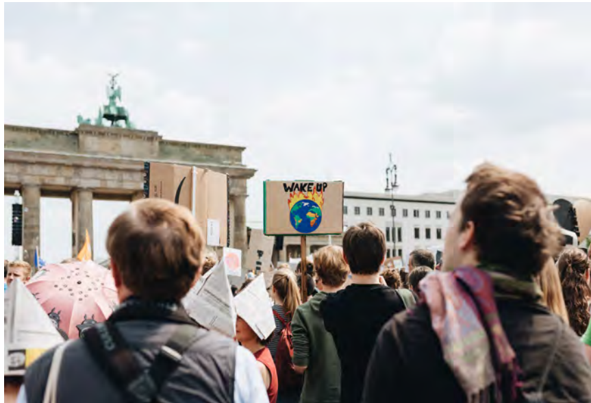
Fridays For Future protestieren für Klimaschutz in Berlin

Für einen effektiven Umweltschutz genügt es nicht, internationale oder europäische Umweltnormen durch ihre Erwähnung in